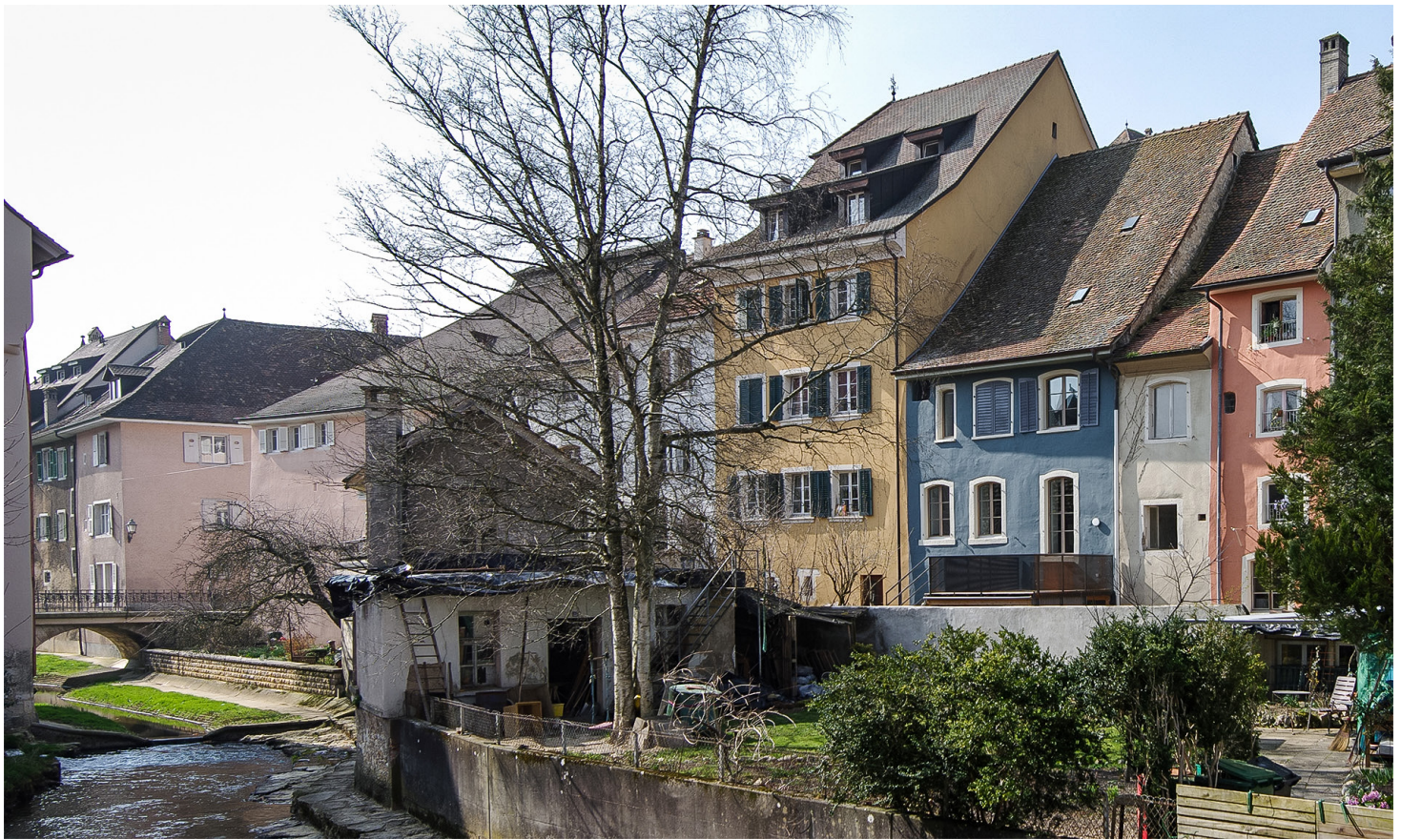
Un bureau d'architectes occupe désormais le rez-de-chaussée et le 1er étage de la maison bleue côté rue. Côté rivière, il a réalisé un appartement de 4 pièces en duplex avec terrasse.