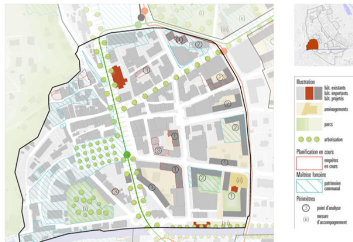
Le plan directeur de densification identifie les potentiels de densification dans le centre-ville. Certains bâtiments projetés sont déjà réalisés ou en cours de construction.

Le projet de requalification de l'espace public visait aussi à encourager la densification du tissu bâti. Pour le secteur du centre-ville qui présente une forte mixité d'affectation et une bonne accessibilité par les transports publics, le plan directeur de densification a identifié un potentiel élevé de développement vers l'intérieur, de près de 800 habitants. Celui-ci concerne principalement la construction de parcelles non encore bâties ou le remplacement d'habitations isolées de faible valeur architecturale. La surélévation ou l'agrandissement de certains bâtiments est aussi envisagé, mais s'avère plus délicate au vu de la valeur patrimoniale du centre historique. La densité visée est de l'ordre de 2.0.