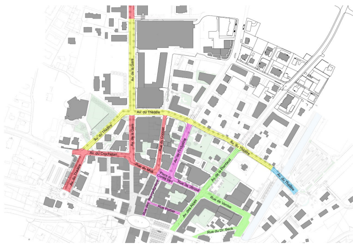
Le réaménagement des espaces publics du centre ville se déroule en plusieurs étapes: 1re étape en 2012-2014 (bleu et jaune), 2e étape en 2015-2016 (rouge), 3e étape en 2019-2020 (mauve) et dernière étape en 2021-2023 (vert).

Les premières discussions qui définissent les priorités pour le centre-ville remontent à la fin des années '90. Elles aboutissent en 2003 à l'instauration d'une commission spéciale pour la mise en consultation du «plan directeur des espaces publics du centre-ville», composée de membres du Conseil municipal et général, de chefs de service communaux, ainsi que de représentants des artisans et commerçants, du collège des architectes et de l'office du tourisme. Il est validé en 2006 par le conseil municipal.