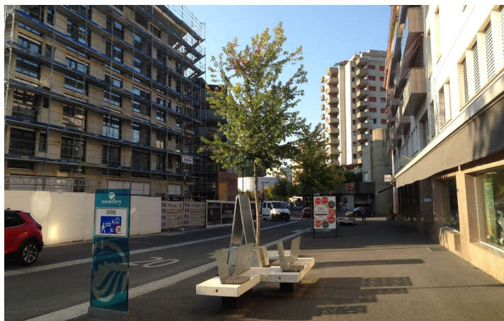
La Petite Ceinture passe de zone 30 à zone 20 avant de rejoindre l'avenue de la Gare, elle aussi classée en zone de rencontre.

La création de zones de rencontre et de zones 30 donne la part belle aux piétons et cyclistes dans le centre-ville, et des abris couverts pour vélos ont ponctuellement été mis en place. Le projet de réaménagement a entraîné la suppression de nombreuses places de stationnement, mais plusieurs parkings souterrains et en surface ont été créés, permettant d'accéder en moins de cinq minutes à pied au centre-ville. Le stationnement sur voirie est destiné en priorité à la clientèle des magasins, avec une tarification progressive qui favorise la courte durée.