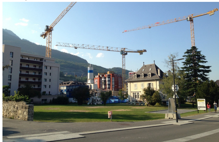
Les projets de densification suivent leur cours dans le centre-ville, tandis que l'espace vert autour de la Maison Blanche est conservé en attendant un éventuel futur projet.

Située dans la plaine du Rhône, la ville de Monthey est le chef-lieu d'un district de neuf communes et la principale ville de l'agglomération du Chablais. Le centre-ville de Monthey regroupe de nombreux services, commerces et équipements publics, pour répondre tant à des besoins locaux que régionaux. La ville est bien desservie par les transports publics, avec la gare CFF qui se trouve à dix minutes à pied du centre et la gare AOMC (ligne Aigle-Ollon-Monthey-Champéry), ainsi que plusieurs lignes de bus urbaines, d'agglomération et régionales qui la traversent. Durant ces deux dernières années, l'offre a par ailleurs doublé, avec un bus qui circule toutes les quinze minutes dans le centre.