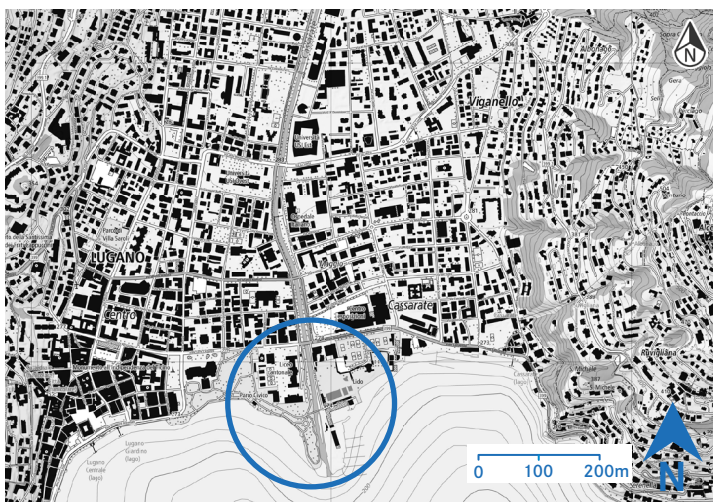
Situation du Foce del Cassarate.

Le parc urbain Foce del Cassarate se trouve au centre de la ville de Lugano sur un lieu qui était autrefois une limite communale. Le site est bien desservi par les transports publics (arrêt de bus au nord du site) et est facilement accessible à pied ou à vélo depuis la vieille ville de Lugano à travers le parc Ciani. Plusieurs cafés, restaurants et le lido se trouvent au bord du parc.