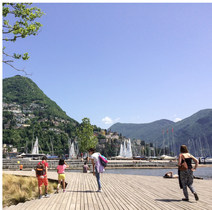
La promenade en bois offre un parcours surélevé au-dessus de la plage et de l'eau tandis que les emmarchements en pierre (à droite) permettent de s'installer tout près de la rivière.

La ville de Lugano n'a pas encore développé de stratégie globale de développement vers l'intérieur (incluant une vision des sites à densifier et des espaces publics). Pour l'instant, elle utilise régulièrement la procédure du concours d'architecture dans le cas de nouvelles constructions. Pour les espaces publics en revanche, la ville a encore peu d'expérience dans le développement de projets avec participation de la population. Cette «première» a provoqué de vives réactions et un vaste débat public sur le financement et la pertinence d'une telle réalisation.