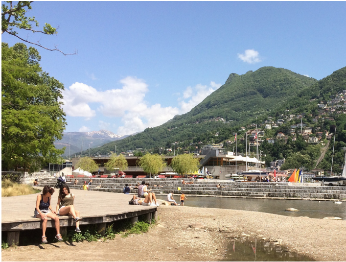
La promenade offre des espaces pour flâner et se reposer. En temps de crues, elle peut être submergée sans s'endommager.