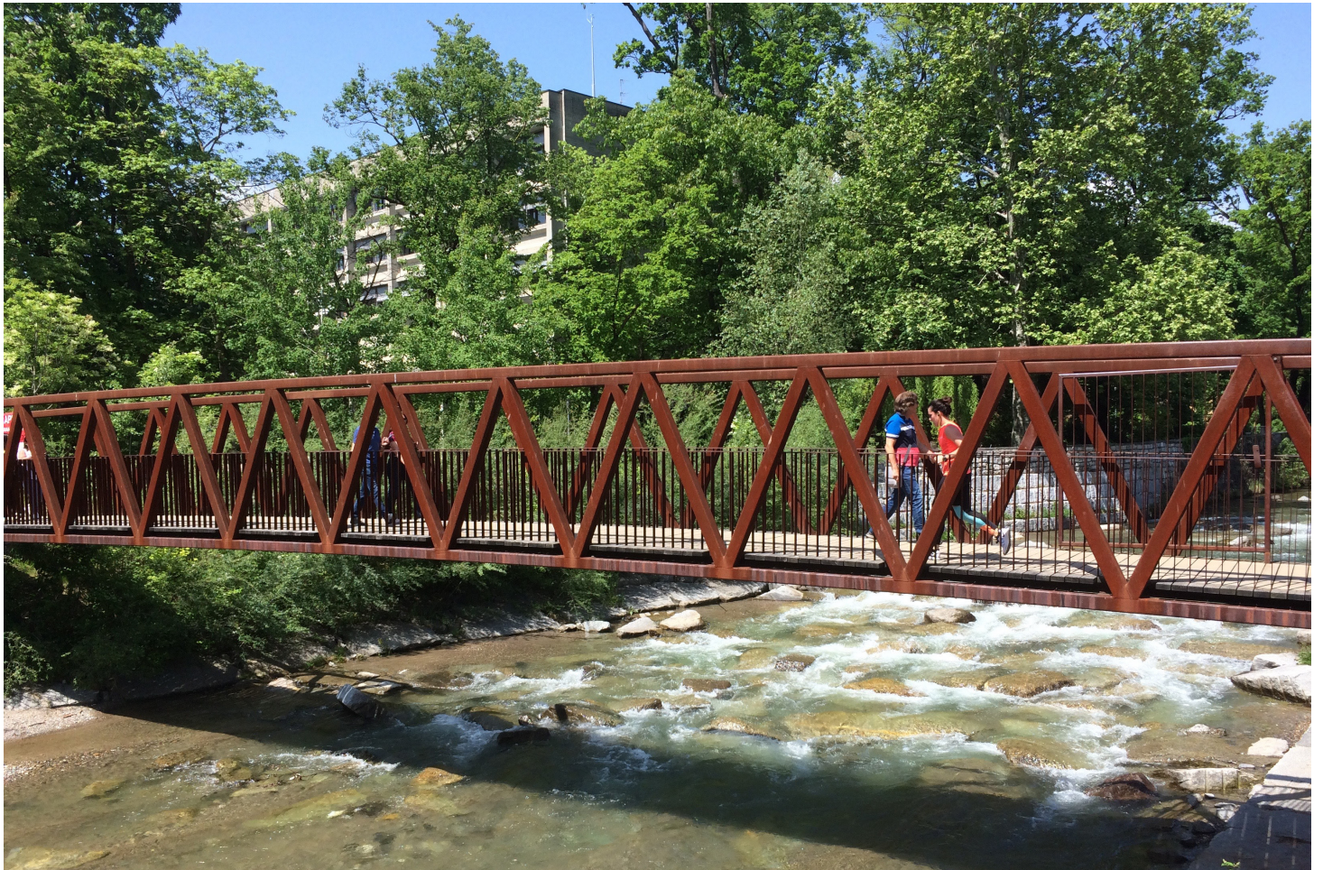
Une nouvelle passerelle pour piétons traverse la Cassarate et relie les deux rives au bon endroit. Elle est également ouverte pour les cyclistes.