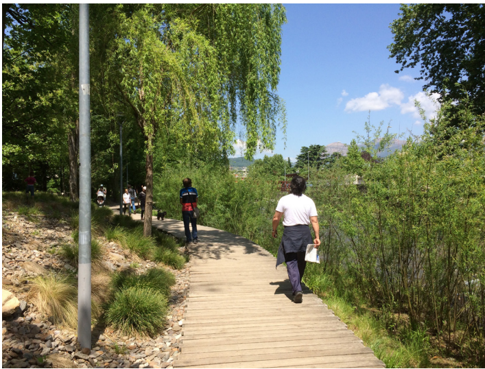
La promenade en bois dessert le nouvel espace vert.