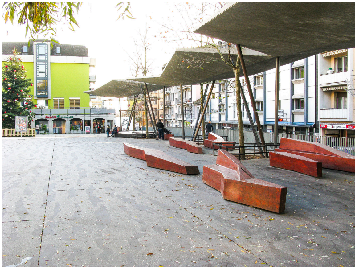
Die Betonbänke und Überdachungen wurden speziell für diesen Platz konzipiert. Sie stellen eine Verbindung her zwischen dem neuen Platz und den bestehenden Gebäuden im Hintergrund.

Langsamverkehr nur wenig Platz zugestanden. Mit der Umwandlung von Strassen in eine Begegnungs- und Fussgängerzone konnte ein verzweigtes Wegnetz für den Langsamverkehr geschaffen werden, das bis zum Bahnhof reicht. Zudem wurden neue Bäume gepflanzt und Grünflächen angelegt, beispielsweise die Square de la Savonnerie und die kleinen Gärten entlang der Rue Neuve. Alle diese Eingriffe bringen einen Mehrwert nicht nur für das Quartier um den Place du Marché, sondern für die ganze Bevölkerung der Stadt.