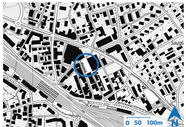
Lage des Dorfsplatzes.

Historisch war dieser Stadtteil stark von Autos geprägt. Davon zeugen die breite Strasse im Norden (Avenue du 14-Avril) und das Migros-Einkaufszentrum aus den 1970er Jahren mit seinem grossen Parkplatz. Einzig die Place du Marché war vom Verkehr verschont geblieben. Insgesamt wurde dem