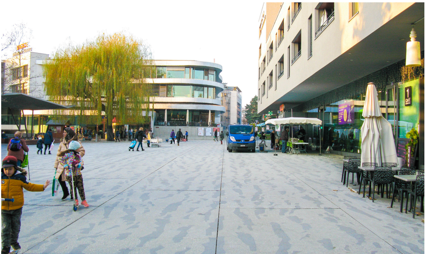
Die neu gestaltete Place du Marché bietet der Bevölkerung von Renens einen Ort der Begegnung mit Geschäften für den täglichen Bedarf, einem wöchentlichen Markt und neuen Wohnungen.