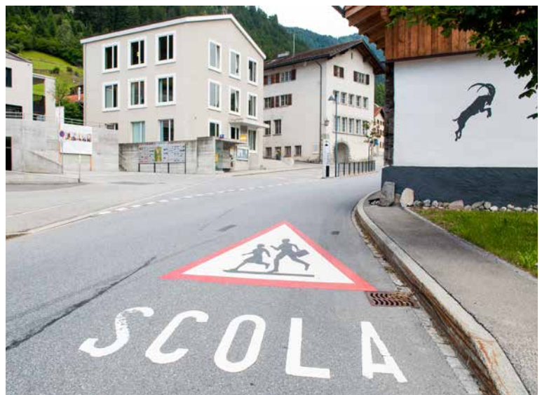
An die Dorfschule erinnert noch die Strassenmarkierung (rechts). Das einstige Restaurant «La Steila» wartet weiterhin auf eine Zukunft.