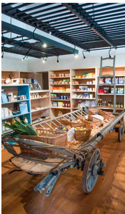
Der Gastraum des «La Scuntrada» kombiniert Alt und Neu. Schaukelringe erinnern an die Turnhallen-Vergangenheit. Unten: Der Dorfladen im «La Scuntrada» mit der alten Sprossenwand an der Decke.

Der Gastraum und die offene Küche wirken heute hell und originell. Die Turnhallenfenster sind grösser