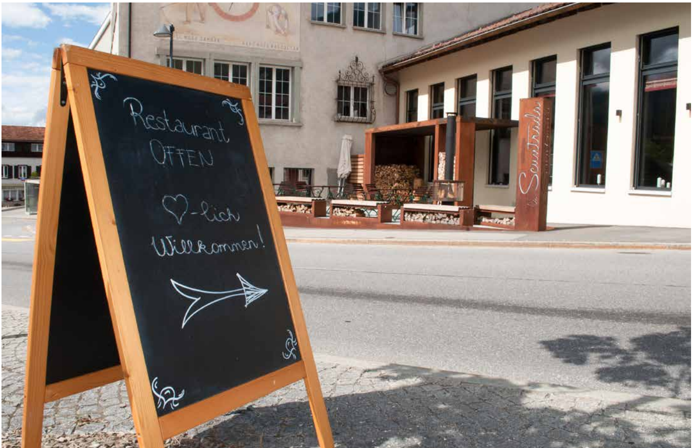
Das neue Restaurant «La Scuntrada», erstellt in der früheren Turnhalle der Dorfschule, heisst Gäste willkommen.