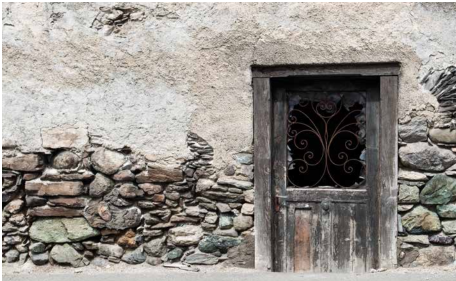
Viele stattliche Gebäude in Tinizong stehen leer.

Von Tiefencastel her schlängelt sich die Strasse hinauf zum Julierpass, vorbei am Tourismusort Savognin, vorbei auch am langgezogenen Strassendorf Tinizong-Rona. Die meisten fahren vorbei, doch wir stoppen hier, vor den zwei Gemeindehäusern. Das ältere ist ungenutzt, das neuere beherbergt die Verwaltung der fusionierten Gemeinde Surses. Surses entstand 2016 aus der Fusion von neun Bündner Dörfern, darunter Tinizong-Rona.