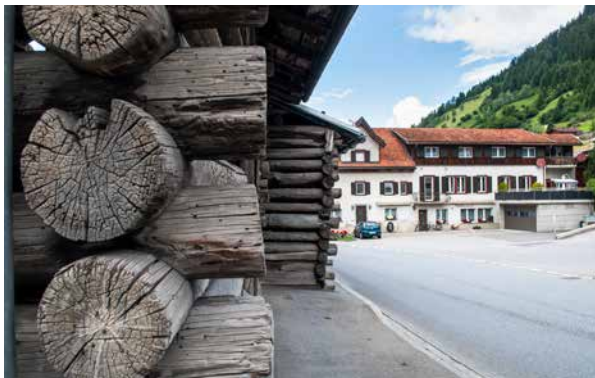
Mächtige Stämme sind typische Elemente der Stallbauten in Tinizong.

2014 fand in Tinizong ein zweiter Workshop statt, dieses Mal mit dem Titel «Stärkenorientierte Siedlungsentwicklung im ländlichen Raum». Anlass war die Aussicht auf Bundesgelder durch die Eingabe eines Projekts als «Modellvorhaben Nachhaltige Raumentwicklung», wie es auf Bundesdeutsch heisst. Architekt Nüesch, Vertreter der Gemeinde und des Kantons Graubünden, private Liegenschaftseigentümer und Zweitwohnungsbesitzende sowie Experten der VLP-ASPAN besprachen Ideen, wie das unternutzte Dorf durch Siedlungsentwicklung nach innen wieder belebt werden könnte. Schon damals fiel der VLP-ASPAN auf, wie stark Tinizong auf eine besondere Stärke setzen konnte: Wohlhabende und engagierte Zweitwohnungsbesitzer. Das Tinizonger Projekt wurde vom Bund zwar nicht in den Kreis der unterstützten Modellvorhaben aufgenommen. Den Kopf liess man in Tinizong aber darob nicht hängen.