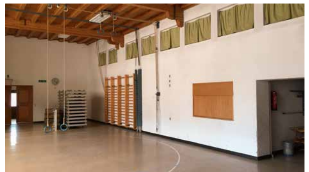
«La Scuntrada» heute (Foto ganz oben). Bis vor wenigen Jahren diente das Gebäude als Turnhalle, bis die Dorfschule 2014 schloss (Fotos Mitte).