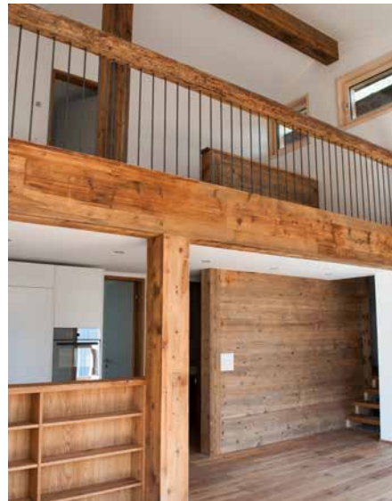
Die einstigen Ställe heute. Architekt Nüesch hat einen Grossteil der alten Holzstämmen wieder an der Originalposition verbaut. Auch im Innern wurde altes Stallholz wiederverwendet.

geplant. Kleinere wären wohl einfacher zu vermieten gewesen. Das Gebäudevolumen musste ich etwas reduzieren und konnte nur zwei, dafür grosse 4,5-Zimmerwohnungen einbauen. Eine andere Folge des Gesetzes ist, dass viele Investoren und Zweitwohnungsbesitzer heute nicht wissen, was eigentlich erlaubt ist und was nicht.