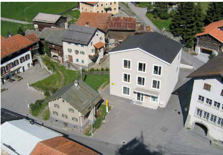
Die Fotos unten zeigen die Vergangenheit: Das frühere Bauernhaus und die Ställe dahinter neben dem neuen Gemeindehaus.