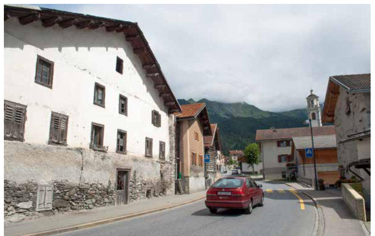
Tinizong war schon immer ein Strassendorf. Einst wurden hier die Pferde der Kutschen auf der Julier-Passroute ausgetauscht. Heute zieht der Autoverkehr durch das Dorf.