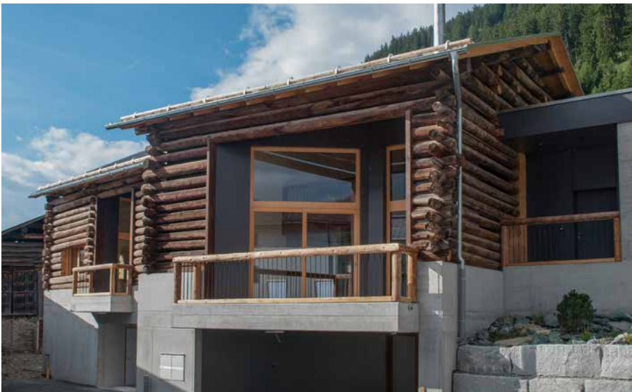
Die ehemaligen Ställe des Bauernhauses bieten heute exklusive, topmoderne Wohnungen (Foto links). Unter anderem ist die Garage mit Steckdosen für Elektro-Autos ausgerüstet.

Ja, den Umbau des Bauernhauses konnte ich nicht in dem Umfang tätigen, wie ursprünglich geplant. Ich hatte mehr Volumen und mehr kleinere Wohnungen darin